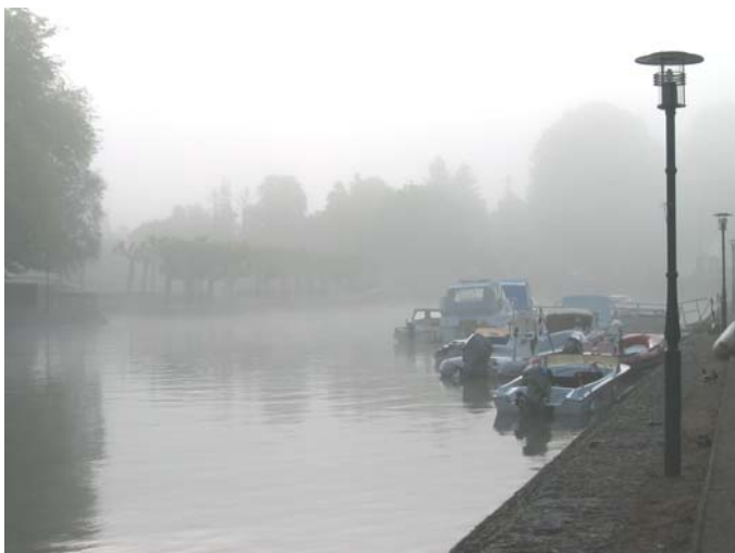
Le bassin de Vierzon au petit matin

Comme toujours à la Pentecôte, depuis quelques années, l'ARECABE a retrouvé ses marques sur le quai du Bassin à Vierzon pour ses 6èmes Rencontres «De Biefs en Écluses ». Tradition oblige, on y a retrouvé le colloque et sa péniche d'or, l'exposition, la randonnée, et de nombreux bateaux en navigation. Par volonté d'élargissement, nous lançons cette année un salon du bateau transportable et des équipements fluviaux, et nous avons établi un partenariat avec le club des philatélistes en congrès à Vierzon. Et surtout, cerise sur le gâteau, nous avons enfin pu inaugurer l'ARECABE II, ce bateau tant annoncé, et enfin mis à l'eau, à l'image de la patiente persévérance nécessaire pour la remise en activité du Canal de Berry.