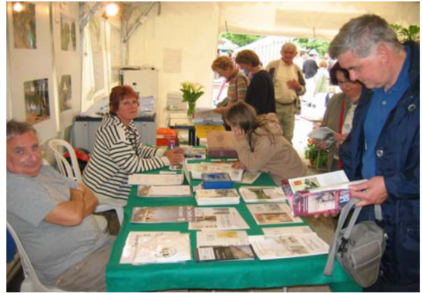
L'accueil de la tente-expo

des points d'accueil courte durée pour accoster, pique-niquer, pêcher, et des lieux d'hébergement pour les randonneurs fluviaux ou terrestres (notamment la halte nautique combi-