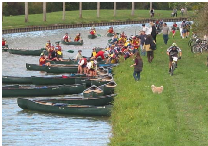
Animations sur le Canal de Bourgogne

Un espace privilégié de navigation de plaisance, vecteur d'un développement économique.