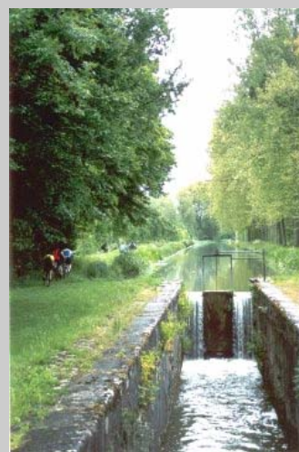
Photo couverture : Le Canal de Berry entre Vierzon et Mehun/Yèvre.