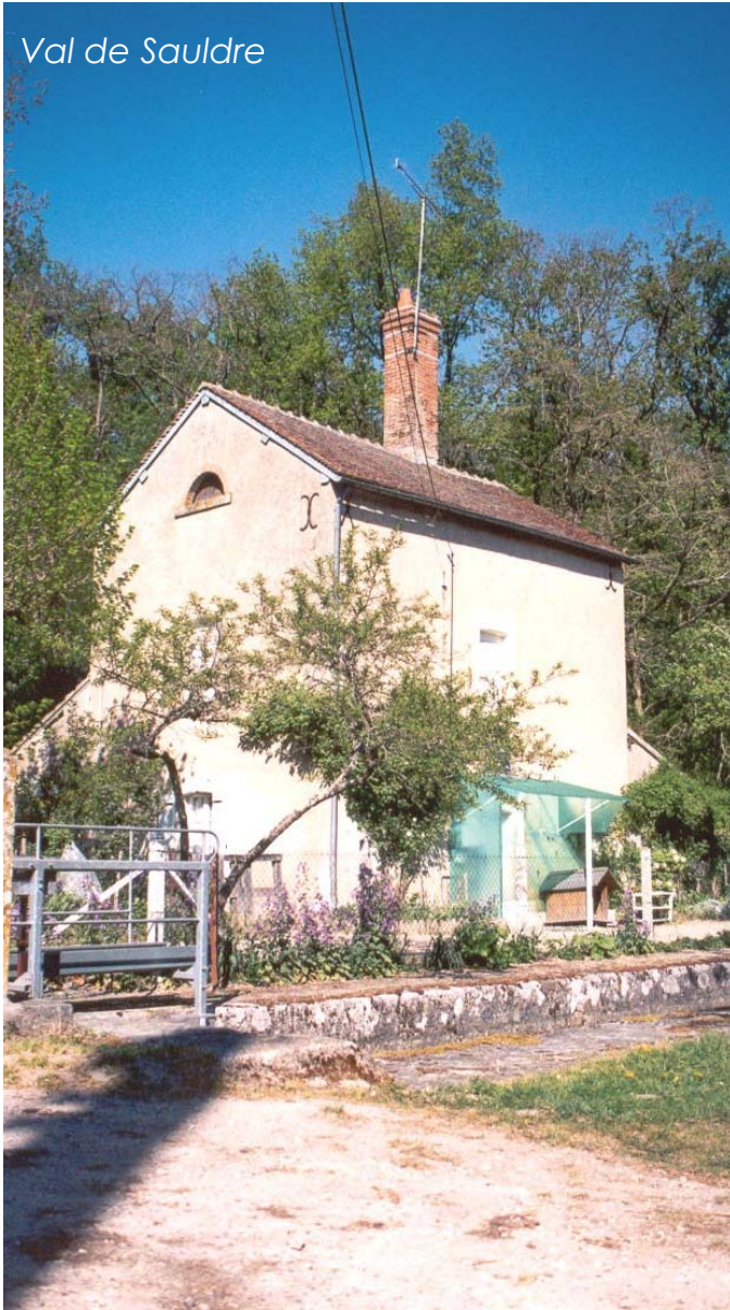
Val de Sauldre

Des modifications architecturales ont d'autre part été apportées après la fermeture du canal de Berry « au goût » des acquéreurs.