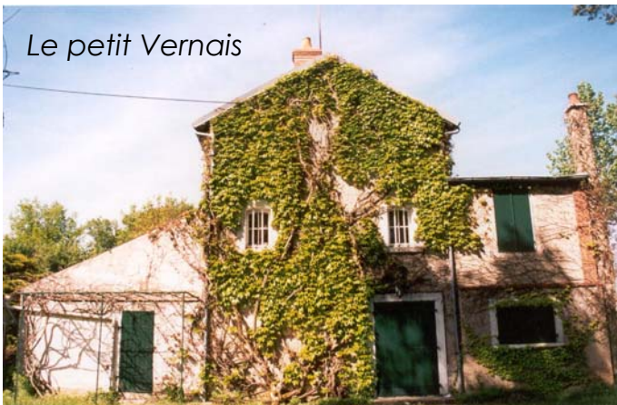
Le petit Vernais

Des ouvertures typiques : Sur le pignon arrière, des ouvertures réduites, semi-circulaires pour les combles et, au niveau du rez-de-chaussée, deux fenêtres rectangulaires, l'une située dans le cabinet, l'autre dans l'escalier, donnaient accès à la lumière du jour pour éclairer ces lieux. Danièle Chompré