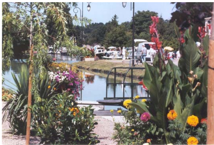
Vue du bassin depuis l'écluse de Cercy.