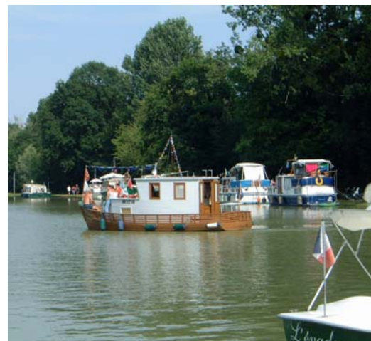
Une concentration de bateaux de toutes origines.

Pour arriver à Cercy-la-Tour, le navigateur venant du canal Latéral à la Loire (via Marseilles-lès-Aubigny, donc sortant du canal de Berry !) a franchi les deux écluses qui ferment le bassin portuaire de Decize, traversé la Loire dans un plan d'eau maintenu par un barrage, longé les quais de la ville, et « embouqué » le Nivernais par une troisième écluse. En saison, cette traversée se fait rarement en solitaire, signe du dynamisme du tourisme fluvial dans ce secteur.