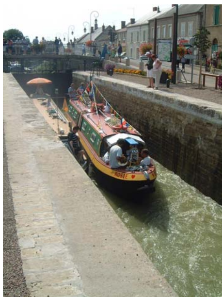
Les Narrow-boats étaient nombreux

Au programme, comme il se doit, une concentration de bateaux, regroupant des plaisanciers de provenance très variée : Anglais et Irlandais notamment pour accompagner les cérémonies officielles de jumelages, mais également le pavillon étoilé d'Australiens, venus des antipodes pour dire leur bonheur de pratiquer la navigation de plaisance en France ! Un aspect cordial de la mondialisation. Ces visiteurs étrangers ont par ailleurs montré un intérêt très vif pour le stand de l'ARECABE, et son pavillon qu'ils se sont empressés d'acheter.